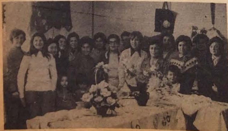
Ahora las clases llegarán a muchos más.

El inicio de las construcciones se consideró como una conquista y a juicio de Luis Moreno las posibilidades de expansión parecían muy remotas, que el presupuesto del Departamento desde hace tres años que se mantuvo congelado.