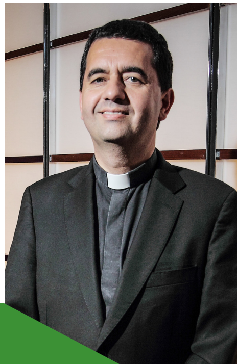
Monseñor Cristián Roncagliolo Pacheco

La Iglesia en Chile está viviendo una crisis de confianza sin precedentes en su historia, cuyas principales 'raíces' están en los abusos de poder, de conciencia y sexuales en los que se han visto envueltos ministros de la Iglesia, así como en el mal tratamiento que se les ha dado a muchos de estos casos. Este fue uno de los temas centrales del reciente encuentro de los obispos con el Sucesor de Pedro. Él nos hizo ver, con lúcida claridad, nuestras llagas abiertas, la epidemia que las han causado y el necesario camino que hemos de recorrer, con urgencia, para enmendar el rumbo, para restablecer la justicia y la comunión eclesial.